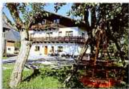
Sirnetl, Fam. Brandstätter altitudine 610m 4580 Windischgarsten, Pichl 27

Bellissima e ampia vallata a 600 m di altezza, circondata da alte montagne sui cui pendii soleggiate sono sparse le fattorie dei montanari tipicamente divise in due: le abitazioni e le rimesse. Malghe e rifugi fanno da punto di appoggio per escursionisti ed alpinisti. Numerose le possibilità di escursioni: alla sorgente "Piesling" di Raßleithen (la più grande sorgente varcata nelle alpi nord), alla goida "Dr. Vogelzung" con il museo dei dipinti in roccia a Spital/Pyhrn, al parco nazionale "Teichboden", al lago "Brunntem" sulla malga "Wasser", alla spiaggia sul lago di "Gleinker" la teleferica Spital/Pyhrn-Wasseralm, seggiovie e scivole rendono possibile lo sci alpino e di fondo, nota località di villeggiatura al centro della vallata è Windischgarsten che offre tutte le attrezzature per lo sci (scuola, noleggio), nonché una pista estiva per slitte lunga 1.530m. per gli amanti dello sport si trovano anche campi da tennis, piscina all'aperto e al coperto riscaldata, minigolf, maneggio, campi squash.