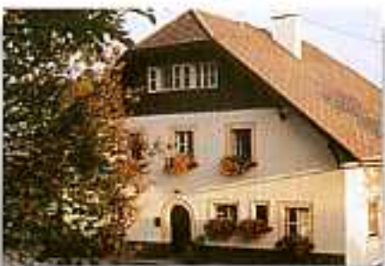
Wauer am Weg, Fam. Aigner alt. 600m 4580 Windischgarsten 144

FATTORIA PRIV. IN POSIZIONE SOLEGGIATA, 18 ha UBICAZIONE: 1,5 km da Windischgarsten, 0,5 km dalla stazione FS e ristorante ANIMALI: bovini, suini, galli CAMERE: 5 D, 1 DDB, 1 APP (casa vacanze di 2/7 pers.) STRUTTURE: barbacoe PASTI: prima colazione, se richiesta merenda cat. II