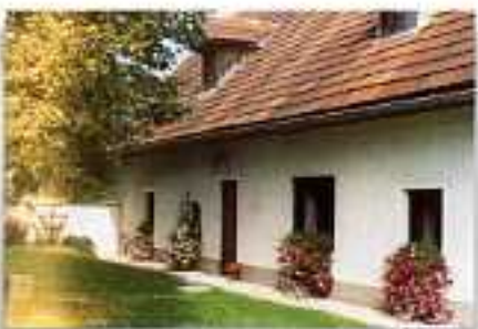
Wichbauer, Fam. Hornal altitudine 600m 4580 Windischgarsten, Pichl 30

FATTORIA IN POSIZIONE TRANQUILLA, 35 ha UBICAZIONE: 1 km da Weyer ANIMALI: bovini, cavalli, suini, galli, conigli CAMERE: 1 APP (casa antica senza cucina) di 2/7 pers. STRUTTURE: barbacoe PASTI: prima colazione e cena