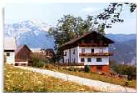
„Chisata“, Fam. Aigner altitudine 800m 4575 Raßleithen, Schweizersberg 298

FATTORIA IN POSIZIONE PANORAMICA, 18 ha UBICAZIONE: 5 km da Windischgarsten, 2 km dal ristorante più vicino ANIMALI: bovini, suini, galli, conigli CAMERE: 2 D, 1 DDB, 2 APP per 2/4 persone PASTI: prima colazione cat. II