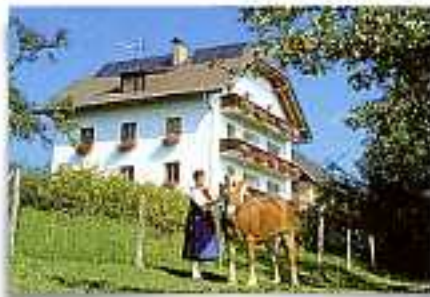
Wegges, Fam. Kletzmayr altitudine 800m 4575 Raßleithen, Schweizersberg 30

FATTORIA IN POSIZIONE PANORAMICA, 30 ha UBICAZIONE: 6 km da Windischgarsten, 2,5 km dal ristorante più vicino ANIMALI: bovini, cavalli, suini, galli CAMERE: 1 APP di 4/5 persone, 1 APP di 8/10 persone (140 m 2 )