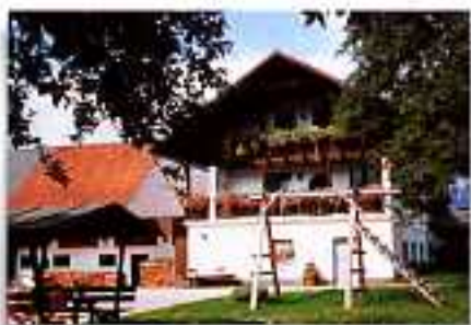
Kändler, Fam. Rabhandl altitudine 590m 4580 Windischgarsten, Pichl 36

FATTORIA IN VALLE, 24 ha UBICAZIONE: 1 km da Raßleithen, 2 km dalla stazione FS e dal ristorante più vicino ANIMALI: bovini, suini, galline, galli, conigli, ovini, caprini CAMERE: 2 APP di 4/6 persone STRUTTURE: barbacoe PASTI: sci soggiorno