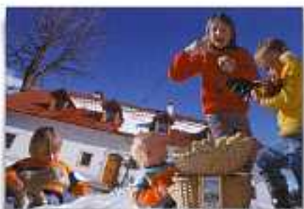
Waldbauer, Fam. Berger altitudine 600m 4580 Windischgarsten, Pichl 1

FATTORIA RECENTEMENTE RISTRUTTURATA UBICAZIONE: 2 km dal paese ANIMALI: ovini, galli, galline, tacchini CAMERE: 3 APP di 4-6 pers. STRUTTURE: giochi per bambini, barbacoe PASTI: prima colazione e cena